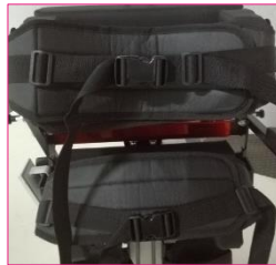
Cinturones de doble contención Double containment belts