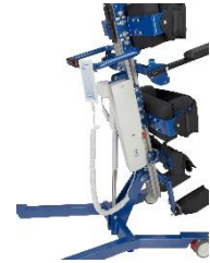
Actuador electrico Electrical actuator