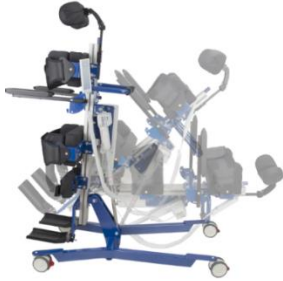
Permite varias posiciones Allows several positions